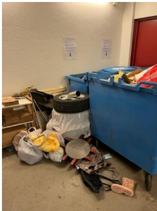
Dåligt samvete någon?

Som väl alla känner till så har renoveringen av garaget dragit i gång. En följd av detta har blivit att miljörummet har flyttat, under tiden garaget renoveras, till en tillfällig lokal intill garageinfarten på samma adress, Gondolgatan 12 och grovsopsinsamlingen flyttade till gången på Pilotgatan 20. De första dagarna fungerade detta bra men redan efter några dagar började det lämnas grovsopor på golvet i miljörummet och därtill sådant som aldrig får lämnas som grovsopor.